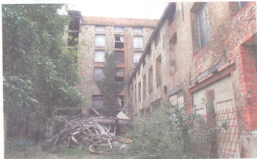
De voormalig brouwerij De Ram aan de Brouwerstraat ligt er nog bouwvallig bij maar wordt binnekort omgebouwd tot een modern woningcomplex.

Het gaat meer bepaald om een werstraat (op maquette beneden), het Handbooghof met de